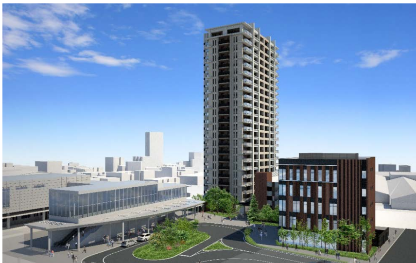
≪ 全体イメージ ≫ ※イメージパース等は今後の協議等により変更となる可能性があります

これまで当地区は、2014年にまちづくり協議会を設立、2017年8月に都市計画決定告示を経て、再開発組合設立に向けて事業を進めて参りました。今後、権利変換計画認可を経て2021年の竣工を目指し、事業を進めて参ります。